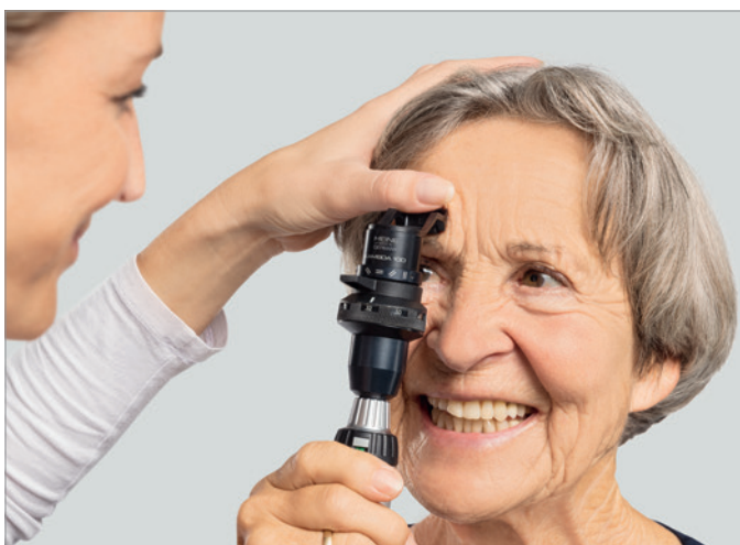
Abbildung 1: Untersuchung mit HEINE LAMBDA 100 Retinometer am Patienten