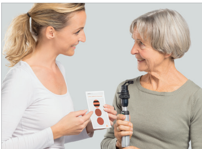
Abbildung 2: Linienmuster in unterschiedlicher Stärke und Ausrichtung